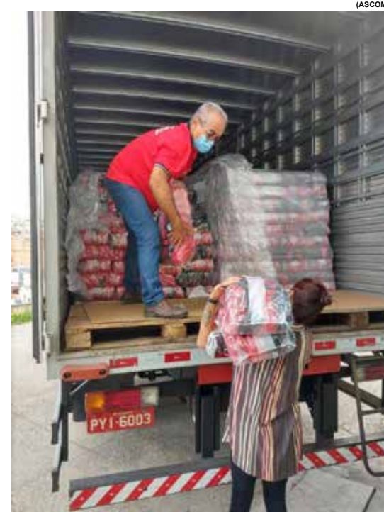
Café Evolutto doou, ao todo, 6 toneladas de pó da bebida para a campanha Band Contra Fome

COOXUPÉ - A Cooxupé representa hoje mais de 16 mil famílias cafeicultoras cooperadas que produzem café verde tipo