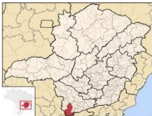
Figura 1: Microrregião de Pouso Alegre

O município de Pouso Alegre está situado no extremo sul de Minas Gerais na Mesorregião do Sul e Sudeste de Minas. A microrregião de Pouso Alegre engloba os municípios de Bom Repouso, Borda da Mata, Bueno Brandão, Camanducaia, Cambuí, Congonhal, Córrego do Bom Jesus, Espírito Santo do Dourado, Estiva, Extrema, Gonçalves, Ipuiuna, Itapeva, Munhoz, Pouso Alegre, Sapucaí-Mirim, Senador Amaral, Senador José Bento, Tocos do Moji e Toledo.