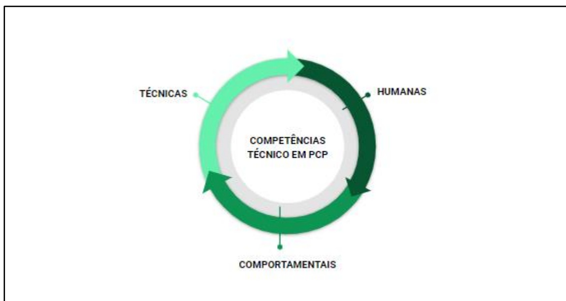
Figura 3. Competências do Técnico em Planejamento e Controle da Produção – PCP

Para atuação como Técnico em Planejamento e Controle da Produção, são fundamentais, que ao término do curso, o egresso adquira competências técnicas, humanas e comportamentais que articulem-se entre si em um processo dinâmico e sistêmico conforme apresentado pela Figura 3.