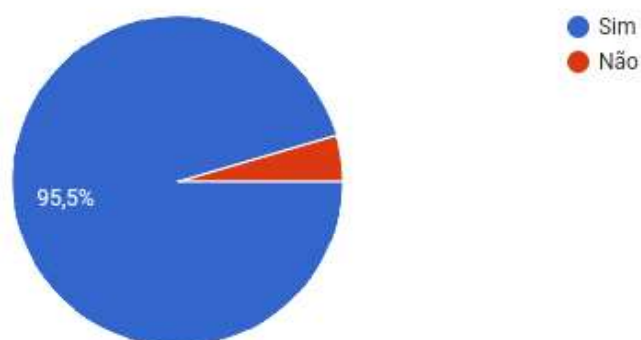
TABELA 1: Representação Gráfica do levantamento de demanda pública sobre a implantação do curso de Licenciatura em Pedagogia Presencial