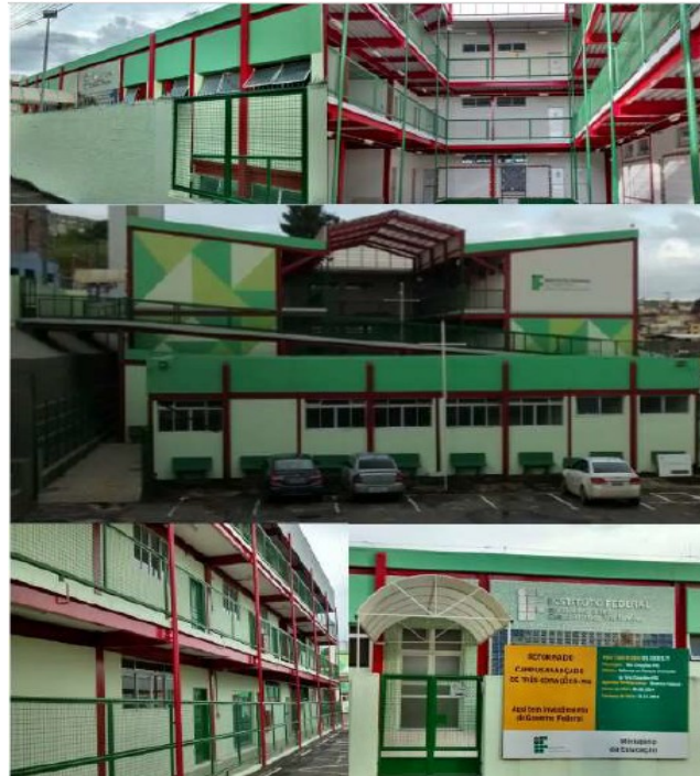
Figura 5 - Blocos pedagógicos e administrativos

O prédio do IFSULDEMINAS, Campus Avançado Três Corações é composto conforme apresentado no Quadro 24 a seguir: