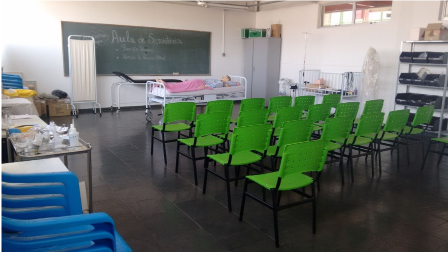
Figura 6 - Laboratório de Enfermagem