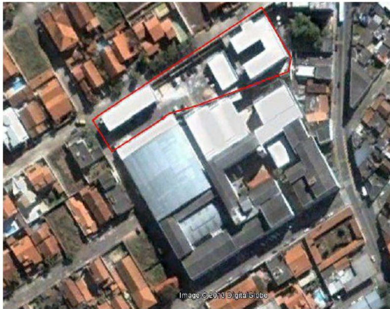
Figura 4 - Vista aérea das instalações do Campus Avançado Três Corações

A seguir são apresentadas a vista aérea das instalações do Campus Avançado Três Corações (Figura 6), a imagem dos blocos pedagógicos e administrativos (Figura 7) e informações sobre a infraestrutura do Campus.