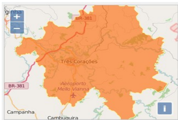
Figura 2 - Rod. 381 em Três Corações/MG

A política de desenvolvimento industrial tem concorrido de forma significativa para a diversificação da produção. Como resultado da conjugação de suas potencialidades, recursos e sua estratégica posição geográfica (Figura 2), Três Corações oferece inúmeras oportunidades de investimentos. O município dispõe de um Distrito Industrial, localizado às margens da Rodovia Fernão Dias (BR-381), ocupando uma área de 2.634.944,47m 2 , se firmando, a cada dia, como um dos polos industriais mais promissores do Sul de Minas.