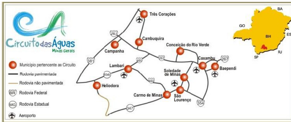
Figura 3 - Municípios pertencentes à região do Circuito das Águas

verificou-se que a implantação do campus avançado em Três Corações seria extremamente relevante e significativa para população e economia local, tanto pela demanda por profissionais qualificados, quanto pela representatividade que o município assume na região do Circuito das Águas (Figura 3), efetivando-se como uma localização estratégica para as políticas de expansão do IFSULDEMINAS.