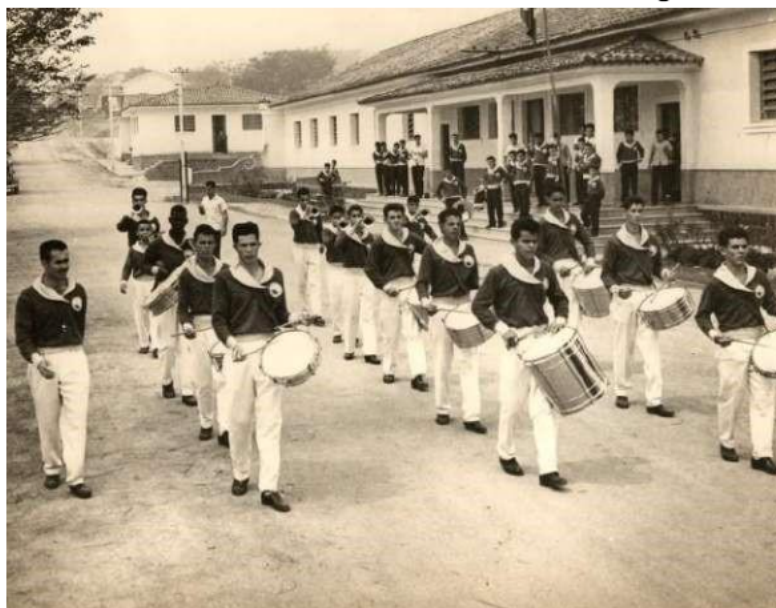
Figura 04 – Desfile da Banda de Música dos Alunos da Escola Agrícola de Machado