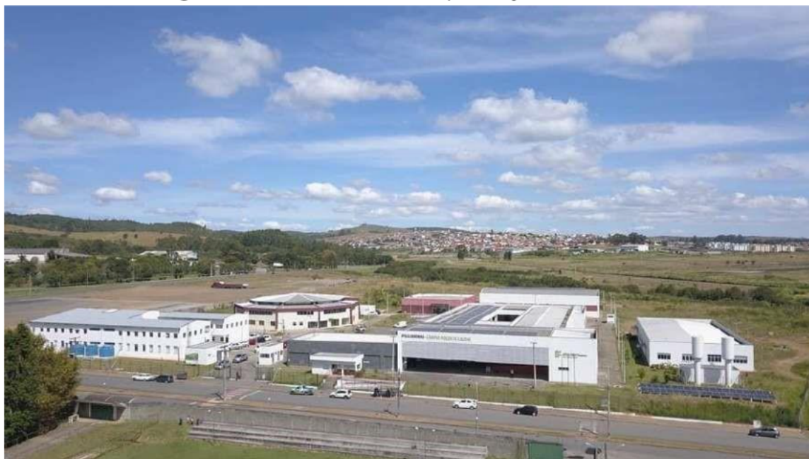
Figura 06 – Vista aérea do Campus Poços de Caldas