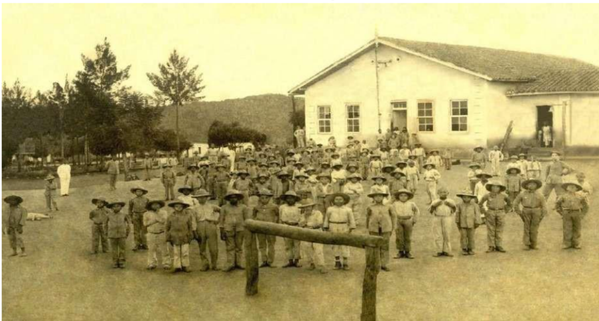
Figura 02 – Primeira turma do Patronato Agrícola de Inconfidentes - 1918