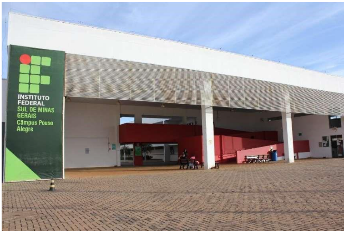
Figura 07 – Fachada da entrada do Campus Pouso Alegre