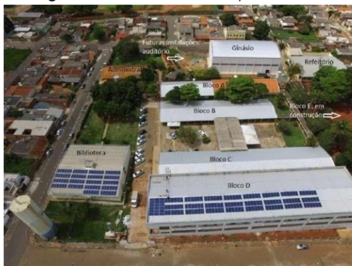
Figura 05 – Vista aérea do Campus Passos