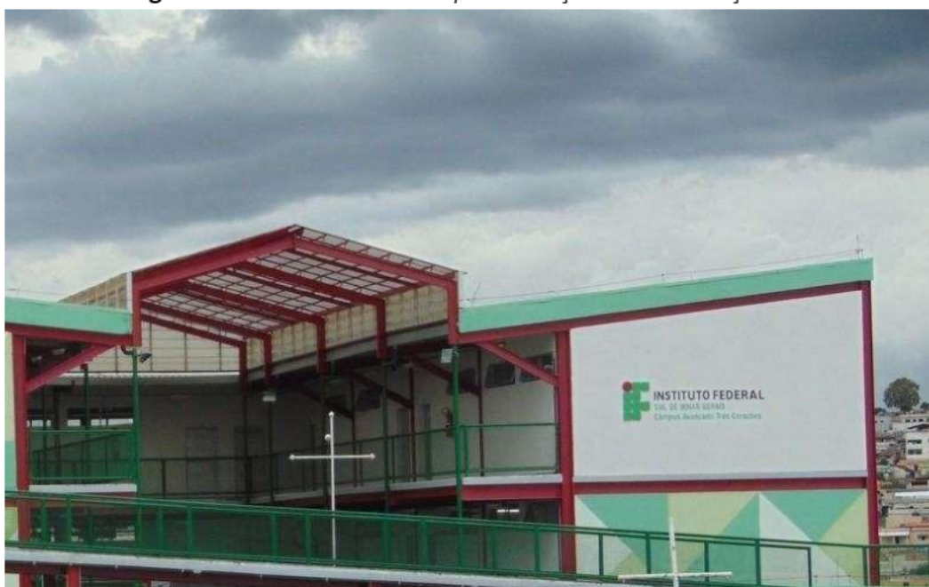
Figura 08 – Fachada do Campus Avançado Três Corações