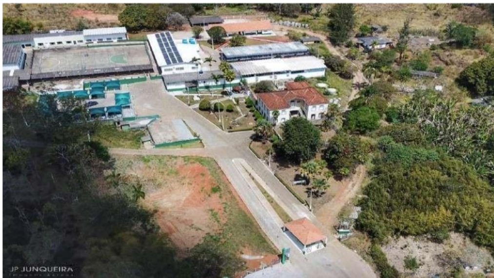
Figura 09 – Vista aérea do Campus Avançado Carmo de Minas