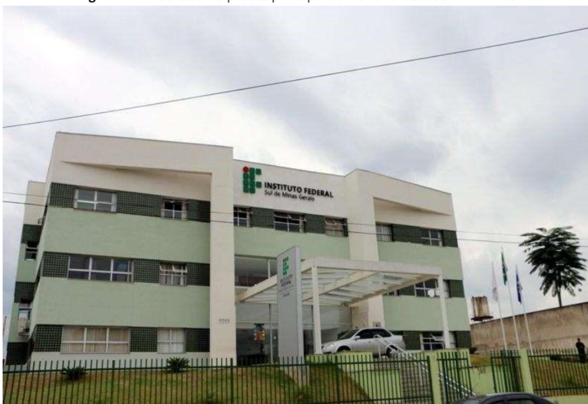
Figura 10 – Fachada do prédio principal da Reitoria do IFSULDEMINAS

Inicialmente, a equipe destinada a trabalhar na unidade reunia-se nos campi agrícolas para discutir os trabalhos. A partir de abril de 2009, foi alugado um prédio de três andares no bairro Medicina, de Pouso Alegre, onde a Reitoria passou a funcionar. Com o aumento das demandas e a expansão do IFSULDEMINAS, em 2012, um prédio anexo ao antigo endereço se juntou à estrutura, abrigando setores como Diretoria de Tecnologia da Informação, Diretoria de Ingresso e a Pró Reitoria de Desenvolvimento Institucional.