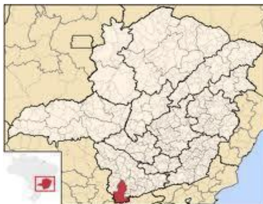
Figura 1 - Microrregião de Pouso Alegre.

O município de Pouso Alegre está situado no extremo sul de Minas Gerais, na Mesorregião do Sul e Sudeste de Minas. A microrregião de Pouso Alegre engloba os municípios de Bom Repouso, Borda da Mata, Bueno Brandão, Camanducaia, Cambuí, Congonhal, Córrego do Bom Jesus, Espírito Santo do Dourado, Estiva, Extrema, Gonçalves, Ipuiuna, Itapeva, Munhoz, Pouso Alegre, Sapucaí-Mirim, Senador Amaral, Senador José Bento, Tocos do Moji e Toledo.