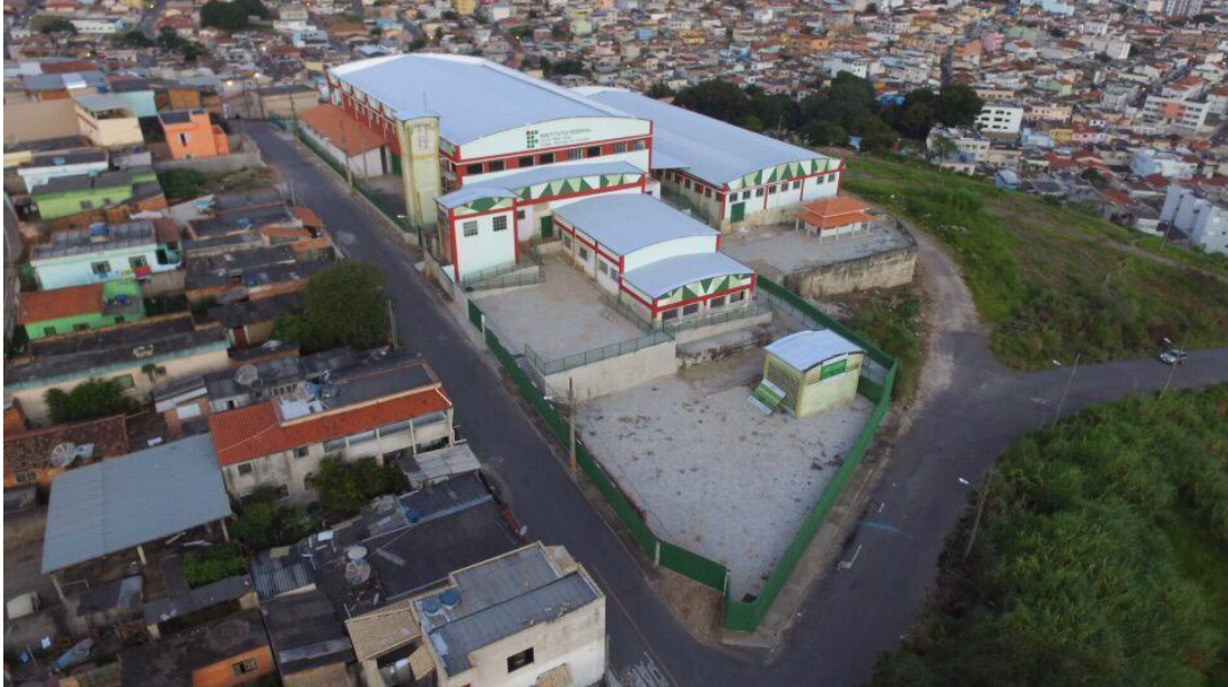
Figura 4 - Vista aérea do Complexo do Atalaia .(Unidade II)