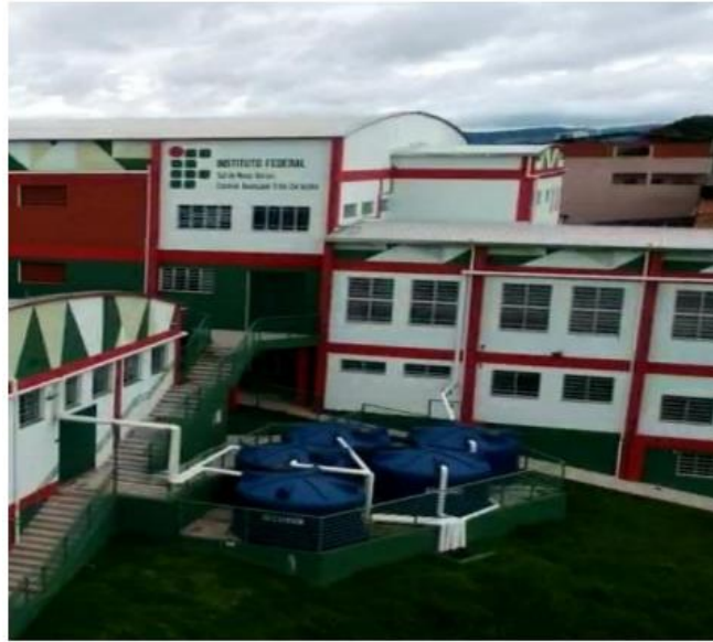
Figura 9 - Estação de coleta de águas pluviais (Unidade II)

E um dos diferenciais deste complexo é possuir sistemas de armazenamento de água potável com capacidade para 70.000 litros e de águas pluviais para reuso, de 214.000 litros. (Figura 9).