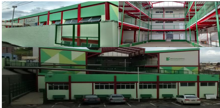
Quadro 50 - Caracterização do prédio da Unidade I