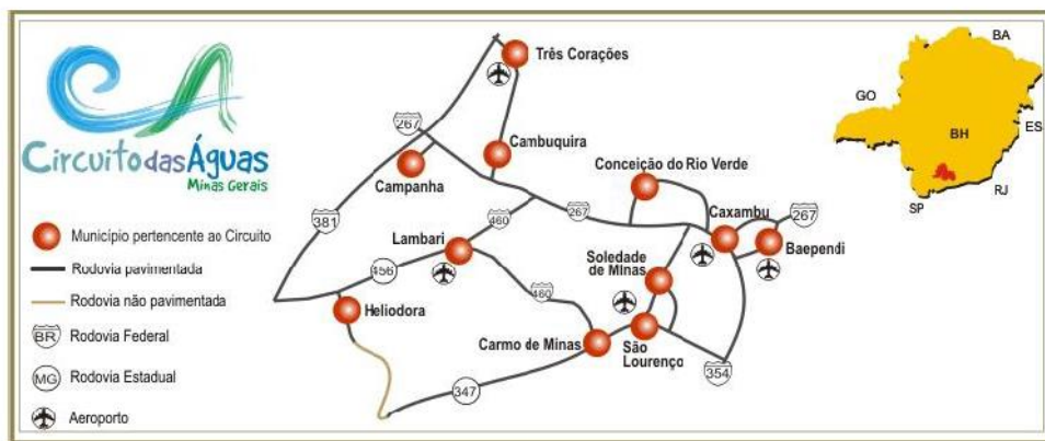
Figura 3 - Municípios pertencentes à região do Circuito das Águas.