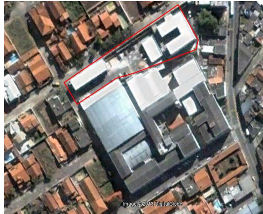
Figura 6 - Vista aérea das instalações do Campus Avançado Três Corações (Unidade I)