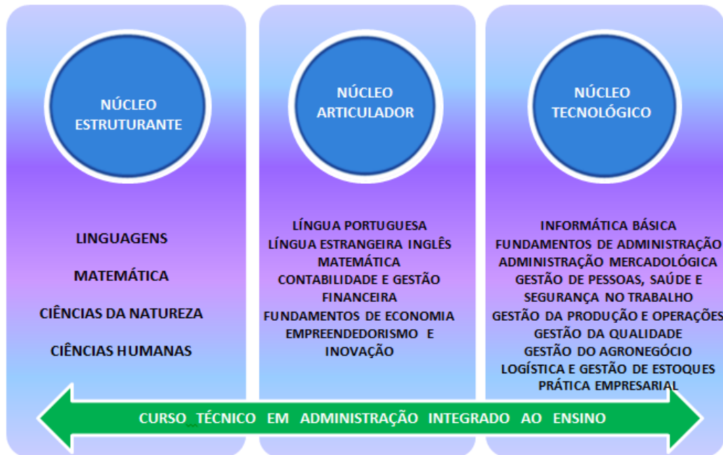
Figura 5 - Representação gráfica do perfil de formação

A distribuição das disciplinas entre os núcleos está representada na Figura 5: