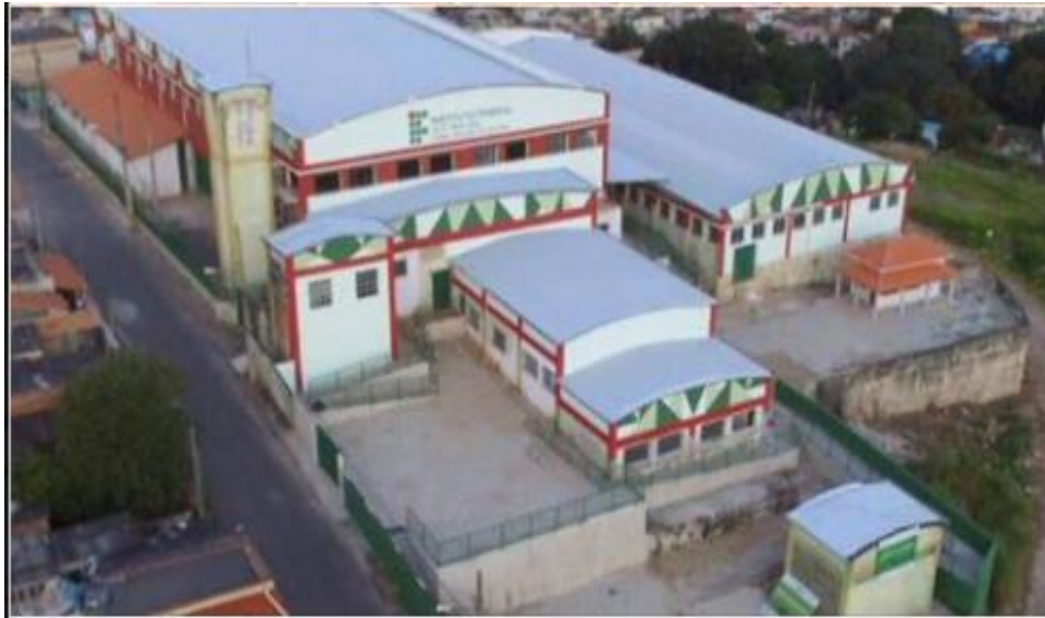
Figura 8 - Novas instalações do Campus Avançado Três Corações - Unidade II

refeitório estudantil, circuito de câmeras de monitoramento; sistema de combate a incêndio e pânico; banheiros acessíveis; guarita para recepção e estacionamento, apresentado na Figura 8.