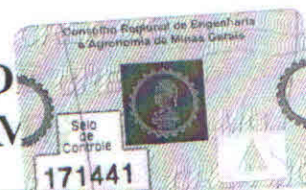
PLANILHA ORÇAMENTARIA DE CUSTOS