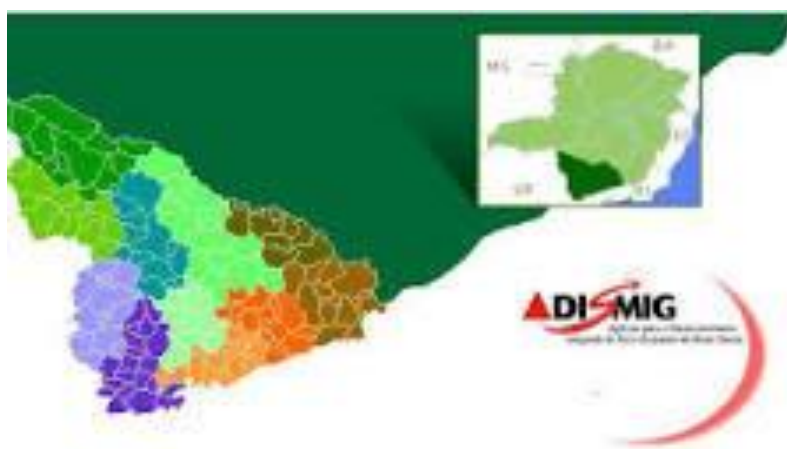
Figura 2 – Área de influência do Campus Poços de Caldas

De acordo com o Instituto Brasileiro de Geografia e Estatística – IBGE (2006), a mesorregião do sul de Minas Gerais, onde está localizado o IFSULDEMINAS, é formada por dez microrregiões, 146 municípios e aproximadamente 2,5 milhões de habitantes. A microrregião do IFSULDEMINAS - Campus Poços de Caldas abrange e influencia diretamente os seguintes municípios: Albertina, Andradas, Bandeira do Sul, Botelhos, Caldas, Campestre, Ibitiúra de Minas, Inconfidentes, Jacutinga, Monte Sião, Ouro Fino, Poços de Caldas e Santa Rita de Caldas (Figura 2).