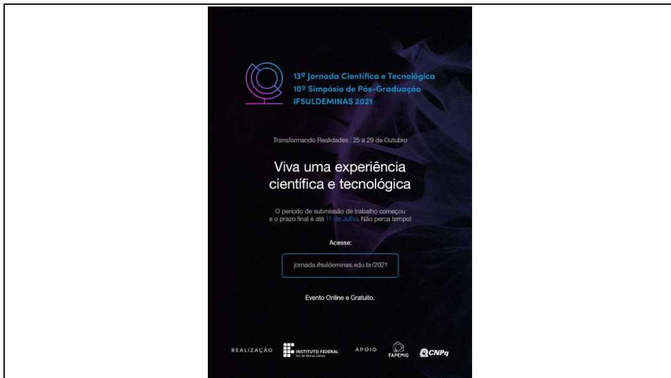
Figure 4: IFSULDEMINAS Scientific and Technological Journey and Postgraduate Symposium poster. Available at: https://jornada.ifsulde Minas.edu.br/2021/ .