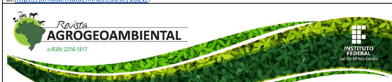
Figure 5: IFSULDEMINAS Agrogeoenvironmental Magazine.