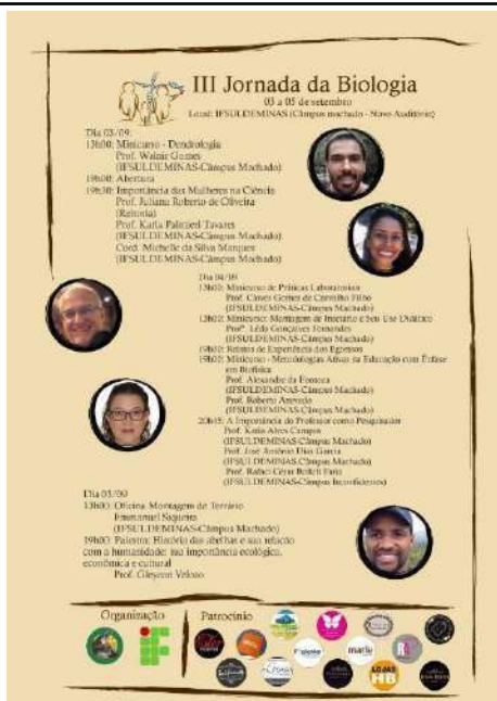
Figure 7: Campus Machado 3rd Biology Week. Available at: https://portal.mch.ifsuldeminas.edu.br/noticias/2186-semana-da-biologia