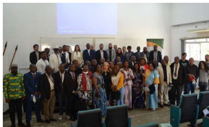
Figure 49: IFSULDEMINAS international cooperation project "Strengthening the Technical and Social and Environmental Capacities of Small Agricultural Producers in the Democratic Republic of Congo (DRC)" .