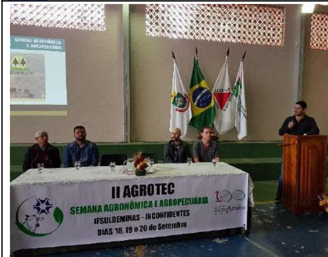
Figure 13: II Agrotec - Agronomic and Agricultural Week. Available at: https://portal.ifs.ifsuldeminas.edu.br/index.php/noticias/269-agrotec