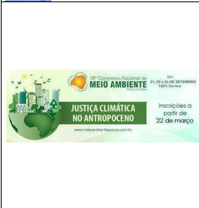
Figure 35: Muzambinho Campus 18th National Environmental Congress of Poços de Caldas .