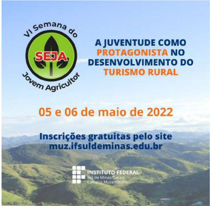
Figure 55: IFSULDEMINAS VI Young Farmer Week (SEJA) .