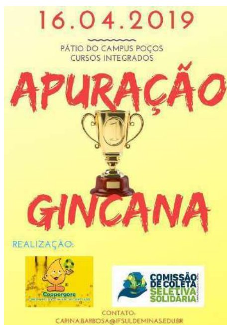
Figure 3: Coopergore School Gymkhana – Collection and Recycling of Waste Oils and Fats. Available at: