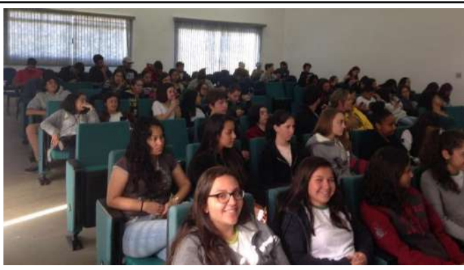
Figure 12: Campus Inconfidentes IV Food Week - Lectures and mini-courses on sustainability and food. Available at: https://portal.ifs.ifsuldeminas.edu.br/index.php/noticias/267-semana-de-alimentos