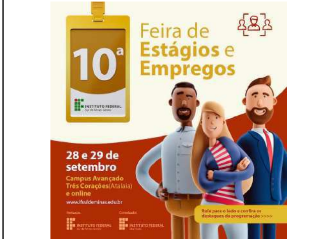
Figure 52: IFSULDEMINAS 10th Internships and Jobs Fair .