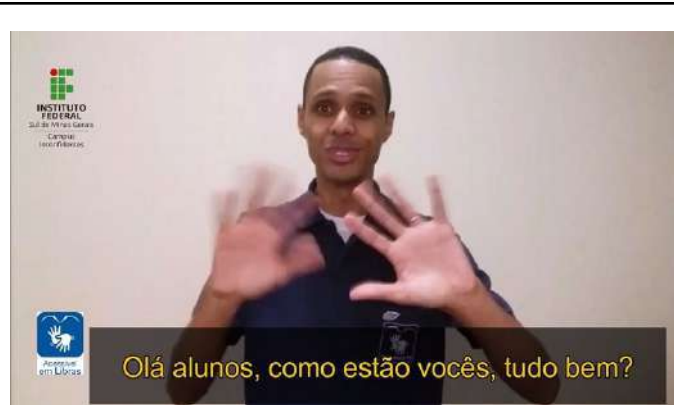
Figure 24: Inconfidentes Campus distance Libras (Brazilian Sign Language) course .