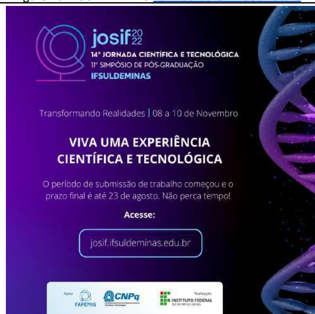
Figure 48: IFSULDEMINAS 14th Scientific and Technological Journey and 11th Graduate Symposium .