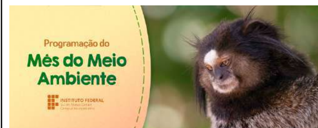
Figure 27: Muzambinho Campus 2020 World Environment Day celebrations .