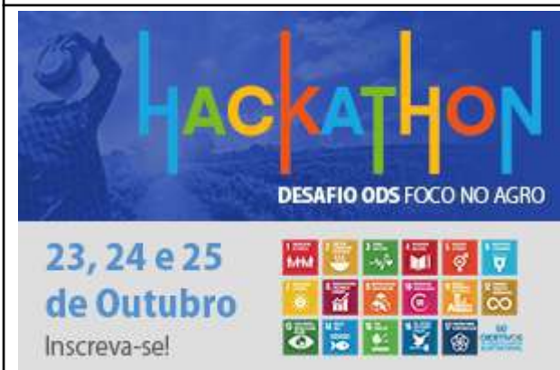
Figure 33: IFSULDEMINAS 3rd Hackathon: ODS Challenge Focus on Agro .