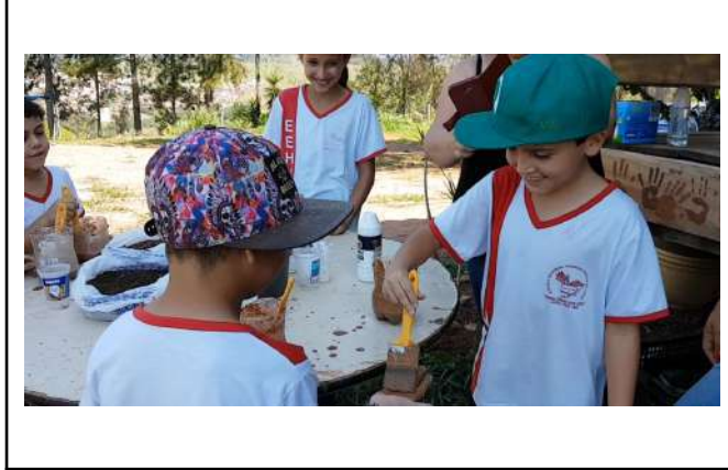
Figure 21: Inconfidentes Campus environmental education for public school students .