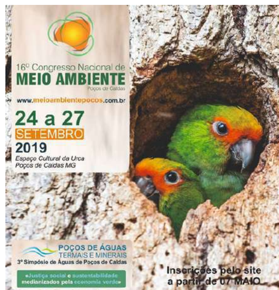
Figure 8: 16 o National Congress of Environment – IFSULDEMINAS Campus Muzambinho institutional support. Available at: http://www.meioambientepocos.com.br/index.html