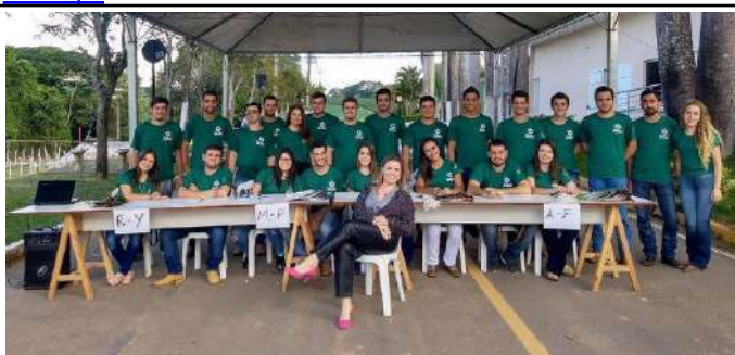
Figure 16: Campus Machado V Week of Agricultural Sciences. Available at: https://portal.mch.ifsuldeminas.edu.br/noticias/1887-ciencias-agrarias