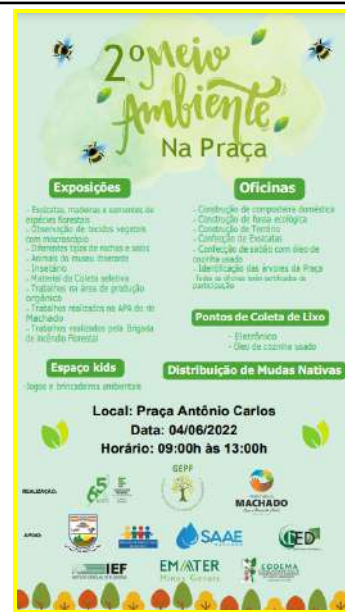
Figure 40: Machado Campus "Environment in the Square".