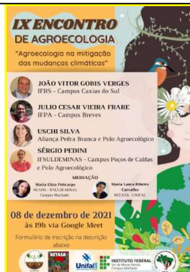
Figure 45: Machado Campus Agroecology Meeting .