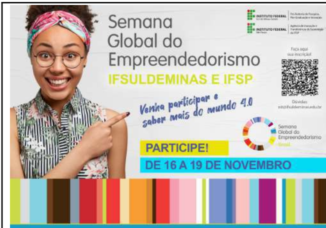
Figure 31: IFSULDEMINAS Global Entrepreneurship Week .