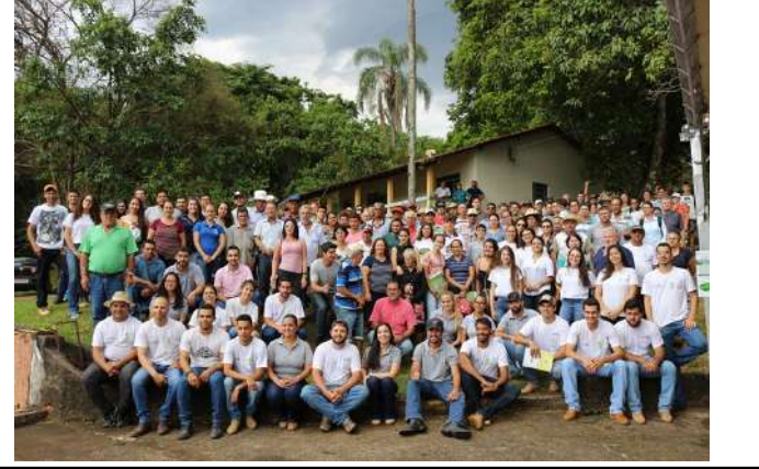
Figure 22: Inconfidentes Campus Field Day on Coffee Sustainability .