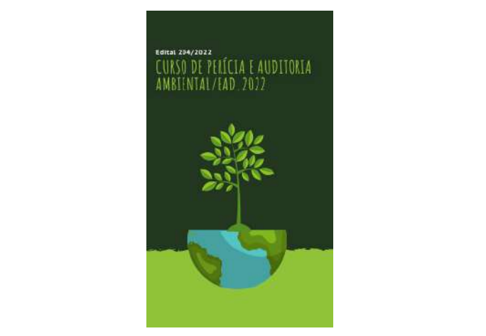
Figure 53: IFSULDEMINAS Environmental Expertise and Auditing Course .