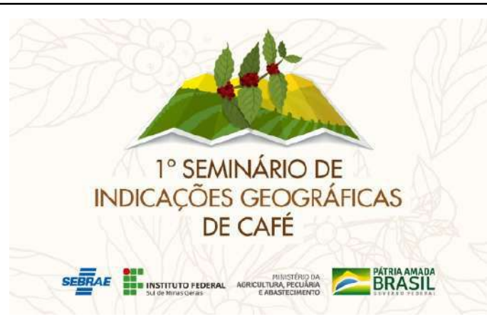
Figure 32: IFSULDEMINAS 1st Seminar on Geographical Indications of Coffee .