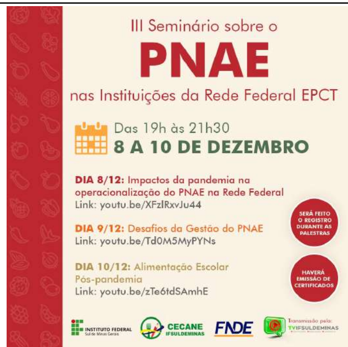
Figure 36: IFSULDEMINAS III National Seminar on PNAE .