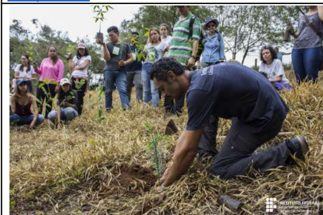
Figure 25: Campus Inconfidentes installation of the Demonstration Unit in Forest Restoration .