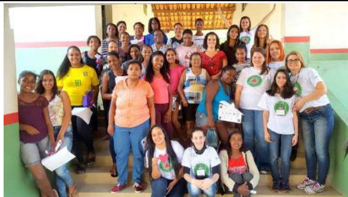
Figure 6: Campus Machado Expedition Program - 10,000 people served by the program in 8 municipalities. Available at: https://portal.mch.ifsuldeminas.edu.br/noticias/2163-projetos-expedicao-ifsuldeminas

https://pocosdecaldas.mg.gov.br/noticias/if-sul-de-minas-colabora-com-a-arborizacao-urbana/