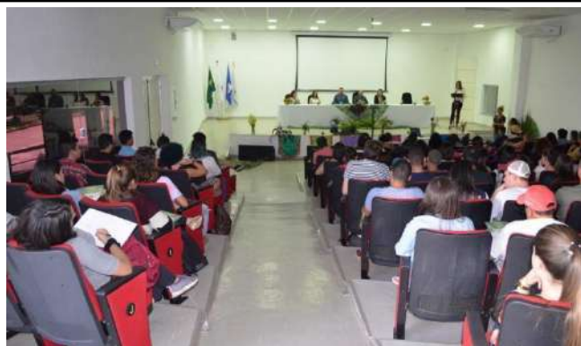
Figure 5: Campus Machado VI Meeting of Agroecology and 1st Fair of Organic and Vegan Products. Available at: https://portal.mch.ifsuldeminas.edu.br/noticias/1883-agroecologia

https://portal.pcs.ifsuldeminas.edu.br/todas-noticias/209-6-gincana-coopergore