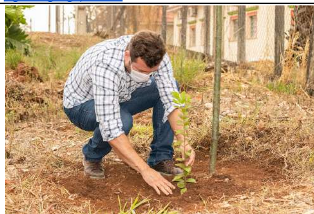
Figure 29: Muzambinho Campus Tree Day .