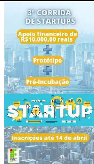
Figure 47: IFSULDEMINAS 3rd Startups Race .