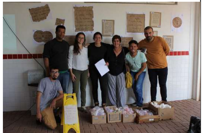
Figure 2: Campus Poços de Caldas workshop on cinema, human rights and environment. Available at: https://portal.pcs.ifsuldeminas.edu.br/todas-noticias/2291-of-icina-cinema-magda-cobertura