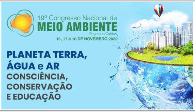
Figure 51: Muzambinho Campus 19th National Environmental Congress of Pocos de Caldas .