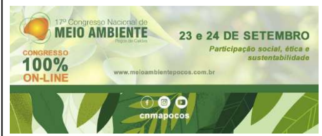
Figure 15: 17 o National Congress of Environment – IFSULDEMINAS Campus Muzambinho institutional support. Available at: http://www.meioambientepocos.com.br/ .