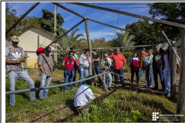
Figure 23: Inconfidentes Campus extension actions with rural producers .