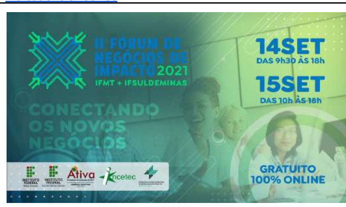
Figure 34: IFSULDEMINAS II Impact Business Forum .