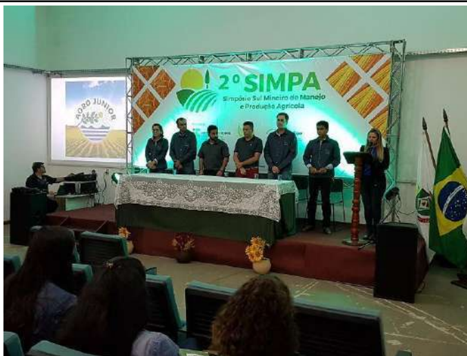
Figure 14: Campus Inconfidentes 2nd SIMPA - Southern of Minas Gerais Symposium on Agricultural Management and Production.