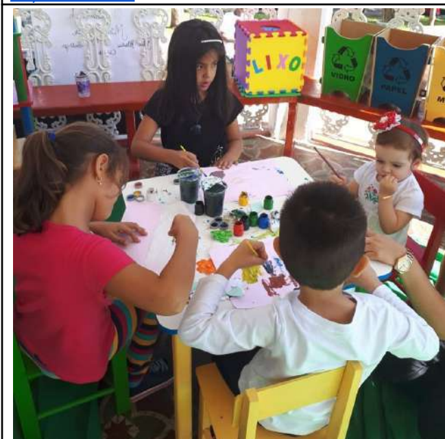
Figure 29: Machado Campus Environment and Botany in the Square .