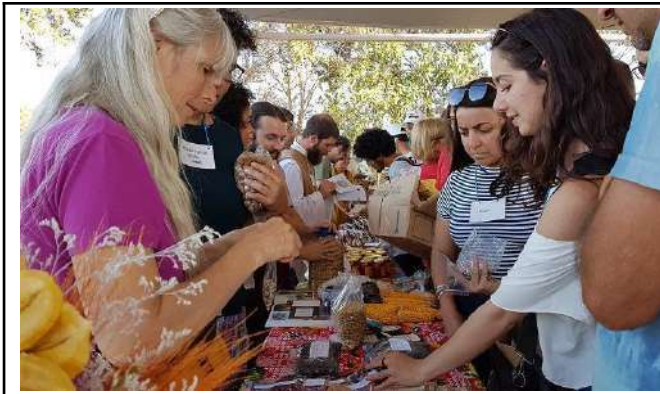
Figure 11: Campus Inconfidentes VIII Feast of Organic and Biodynamic Seeds.