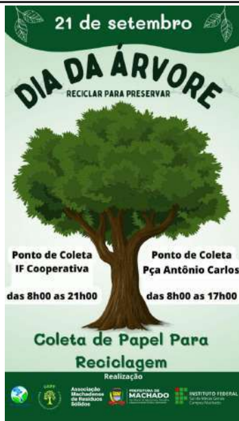
Figure 39: Machado Campus Tree Day.