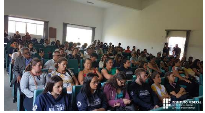
Figure 20: Inconfidentes Campus Impact Business Forum .