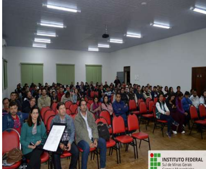
Figure 10: Campus Muzambinho 2019 World Environment Day celebrations. Available at: https://www.muz.ifsuldeminas.edu.br/noticias/2239-ceam-celebra-dia-mundial-do-meio-ambiente