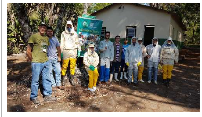
Figure 19: Inconfidentes Campus training courses of SENAR .