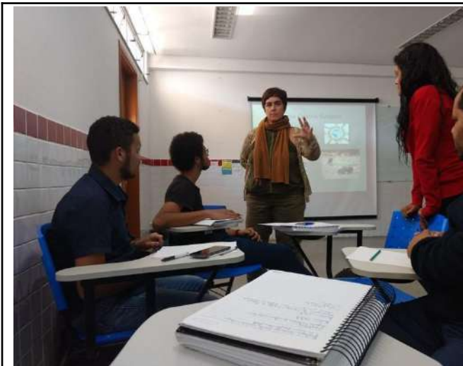
Figure 1: Campus Poços de Caldas film workshop – Students visit oil recycling cooperative.