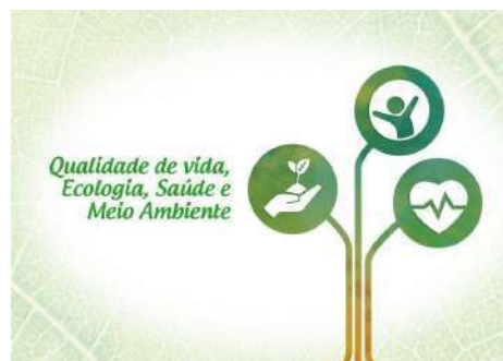
Figure 28: Muzambinho Campus Quality of Life Program .