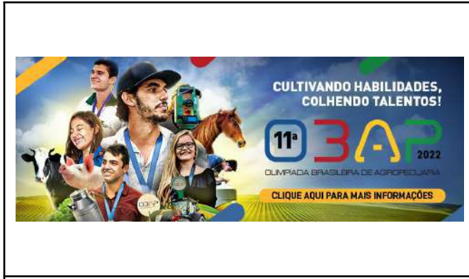
Figure 50: IFSULDEMINAS 11th Brazilian Agricultural Olympiad - OBAP .