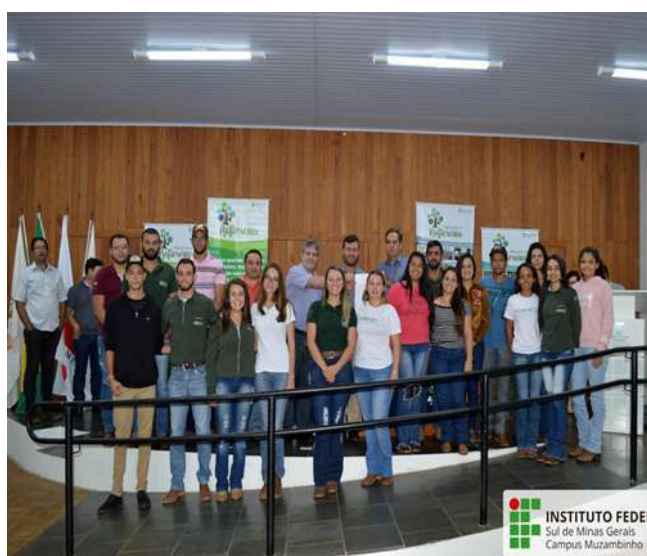
Figure 9: Campus Muzambinho World Water Day celebrations. Available at: https://www.muz.ifsuldeminas.edu.br/noticias/2045-campus-muzambinho-sedia-mais-um-evento-para-comemorar-o-dia-mundial-da-agua