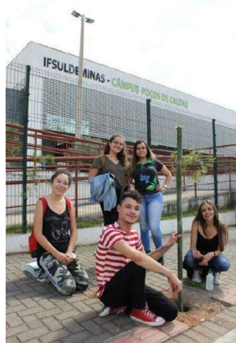
Figure 4: campus Poços de Caldas 1st Environmental Dialogue Cycle – Tree Planting. Available at: