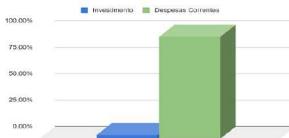
Figura 17 – Alocação de recursos e despesas correntes e de investimento em 2022

A maior parte dos recursos é destinada às prestações de serviços para o funcionamento da instituição. Porém, cabe destacar os valores da ação 2.994, destinados para assistência ao educando, diretamente ligada às atividades que contribuem para o acesso, a permanência e o bom desempenho dos estudantes na instituição.