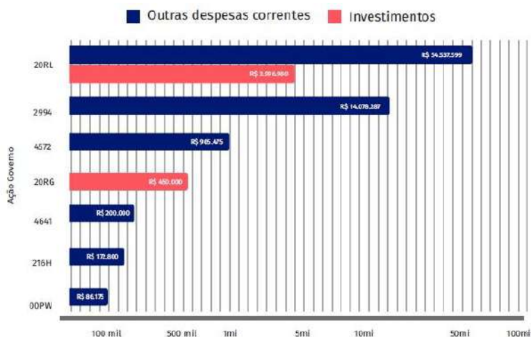
Figura 14 - Alocação de Recursos e Despesas Correntes e de Investimento em 2020