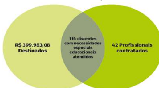
Figura 41 – Programa de Atendimento Educacional Especializado para alunos com necessidades educacionais específicas