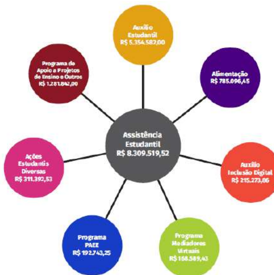
Figura 39 – Recursos destinados à Assistência Estudantil

Os processos seletivos foram reformulados para atendimento às demandas durante o período de pandemia. Com a impossibilidade de realização de provas presenciais, o IFSULDEMINAS implementou a seleção por meio de análise curricular e fortaleceu a seleção com base no desempenho dos candidatos no ENEM. Para efetivação das matrículas, o processo passou a ser realizado de maneira eletrônica, com a utilização de plataformas governamentais, por exemplo, as disponibilizadas pelo “Gov.Br”.