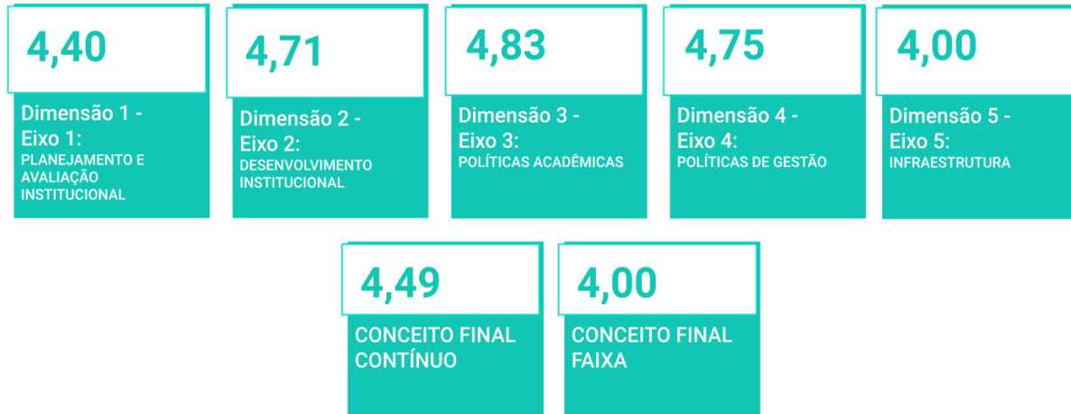
Figura 2: Notas do Red credenciamento Institucional do EaD.

Institucionais e replicado nas locais. Abaixo a Figura 2 mostra as notas obtidas em cada dimensão: