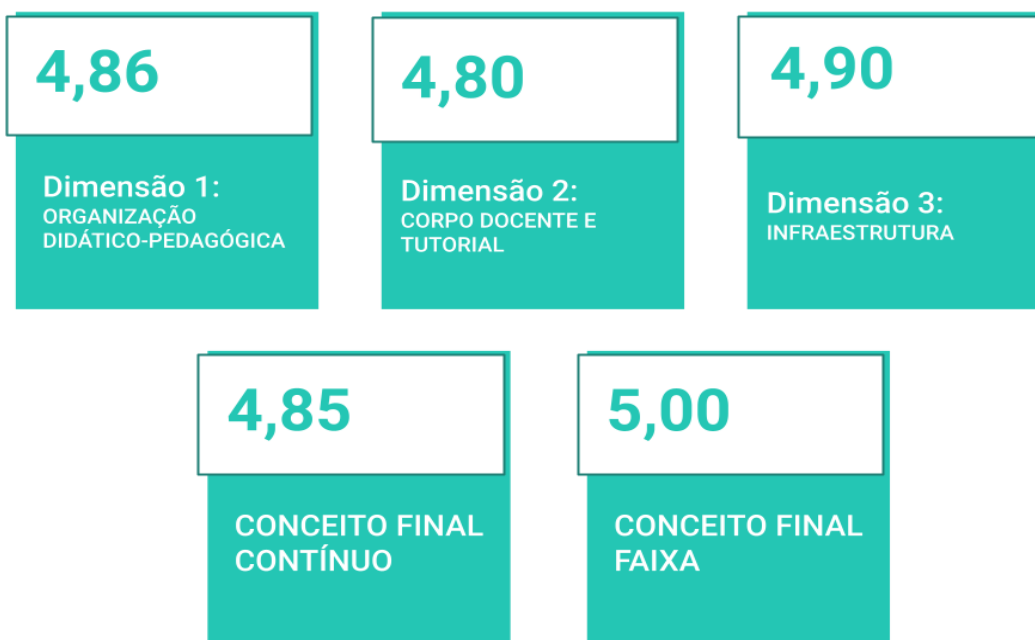
Figura 6: Notas da Avaliação do Curso de Licenciatura em História.

No período de 20/09/2022 a 23/09/2022, o curso de Licenciatura em Pedagogia Presencial passou pelo ato regulatório de reconhecimento de curso do MEC. Abaixo a Figura 7 mostra as notas obtidas em cada dimensão: