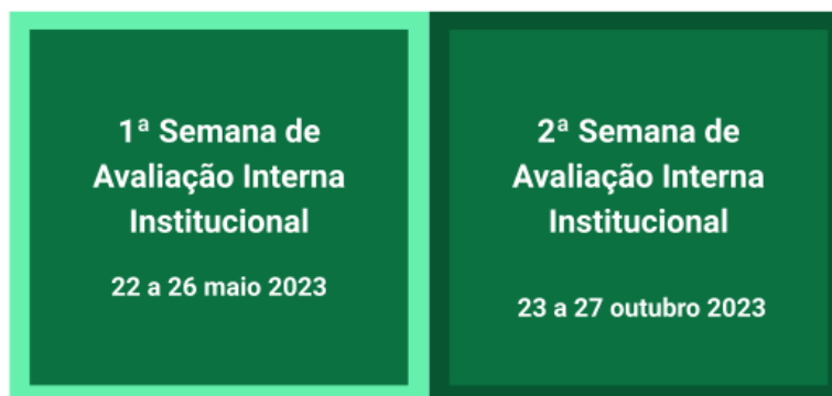
Figura 3:Datas das Semanas de Avaliação Institucional Interna.

Entendemos que a inserção das semanas fixas para a avaliação institucional trará um novo status para a importância da mobilização e participação da comunidade institucional no processo de avaliação.