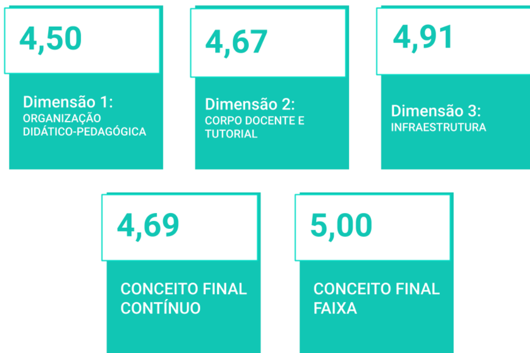
Figura 4: Notas da Avaliação do Curso de Licenciatura em Educação do Campo.

No período de 20/09/2022 a 23/09/2022, o curso de Licenciatura em Pedagogia e Educação Profissional e Tecnológica - EaD , passou pelo ato regulatório de reconhecimento de curso do MEC. Abaixo a Figura 5 mostra as notas obtidas em cada dimensão: